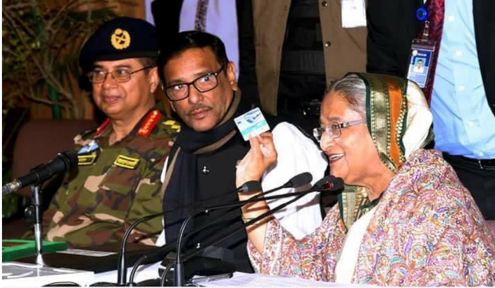
স্বয়ংস্বাক্ষরিত ৪ জানুয়ারি ২০১৮ গণভবন থেকে ভিডিও কনফারেন্সের মাধ্যমে র্যাপিড পাস কার্ড এর কাজ উদ্বোধন করেন মাননীয় প্রধানমন্ত্রী শেখ হাসিনা।