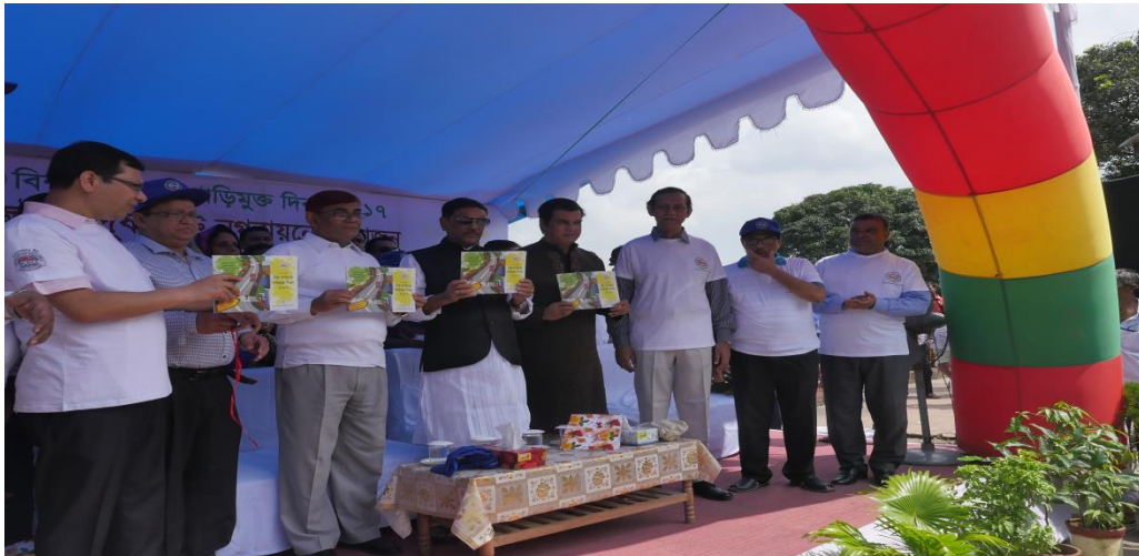
বিশ্ব ব্যক্তিগত গাড়িমুক্ত দিবস উদযাপন ২০১৭